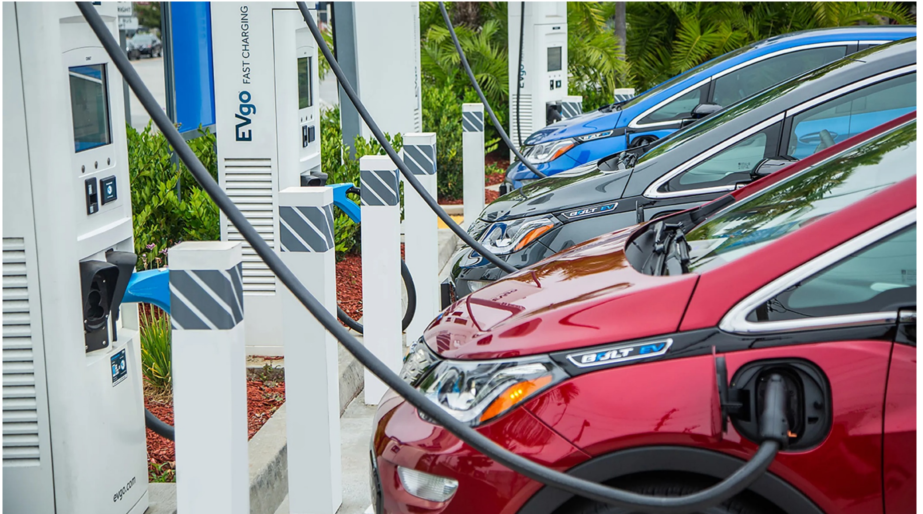
Bornes de recharge de voiture électrique sur un stationnement extérieur