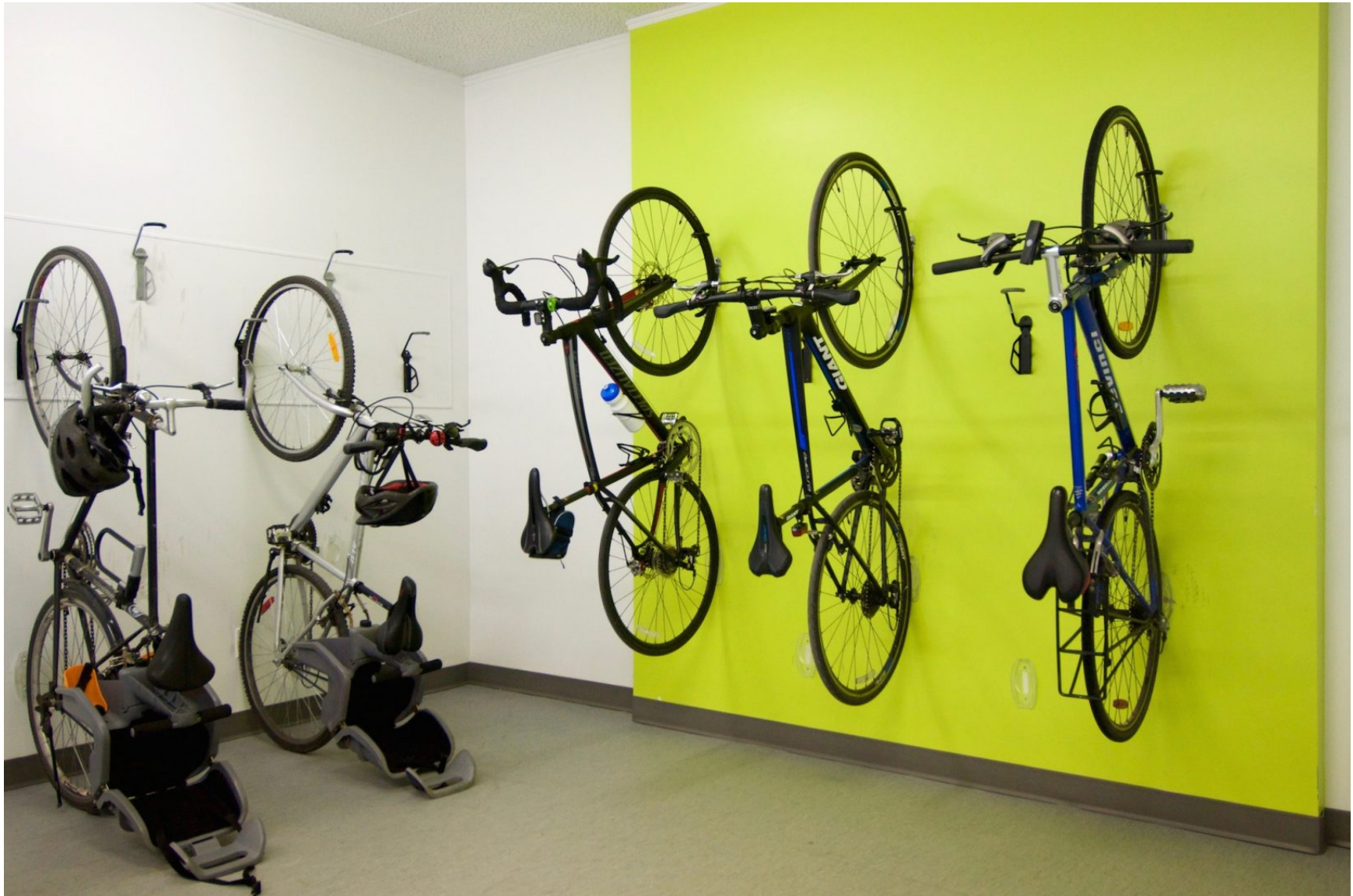
Salle de bicyclettes dans les parties communes d'un immeuble