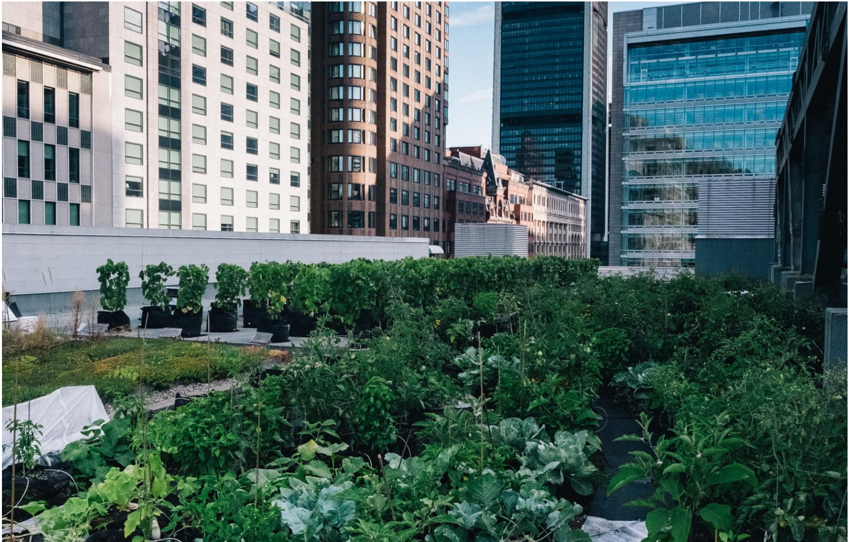
"Potager urbain" sur le toit d'un immeuble