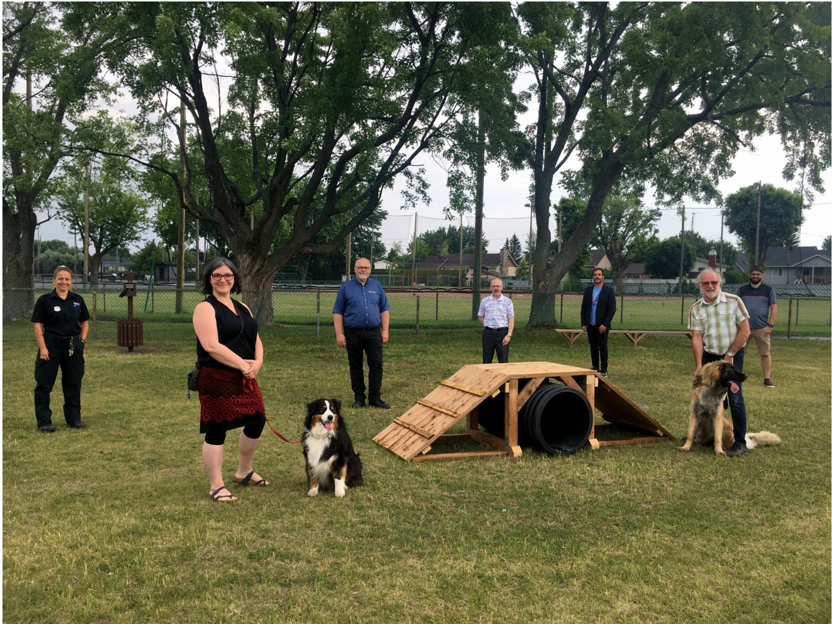
Parc à chiens sur les espaces communs extérieurs de la copropriété