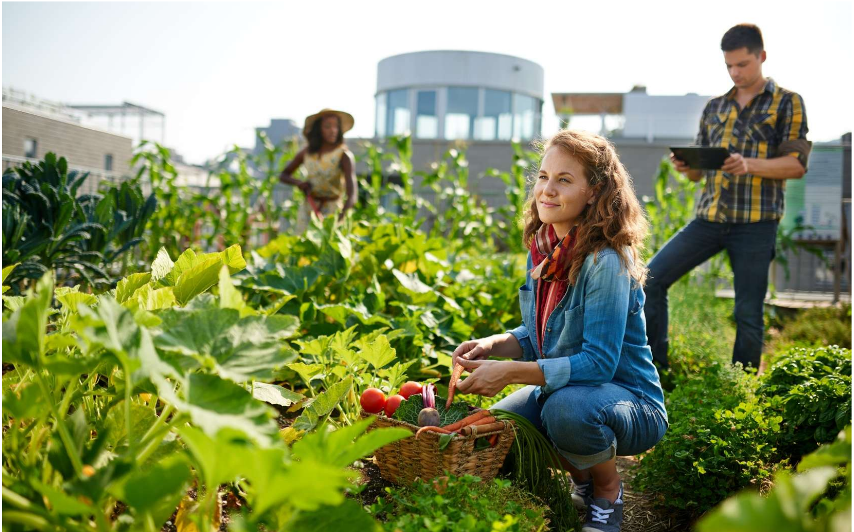
"Potager urbain" sur le toit d'une copropriété