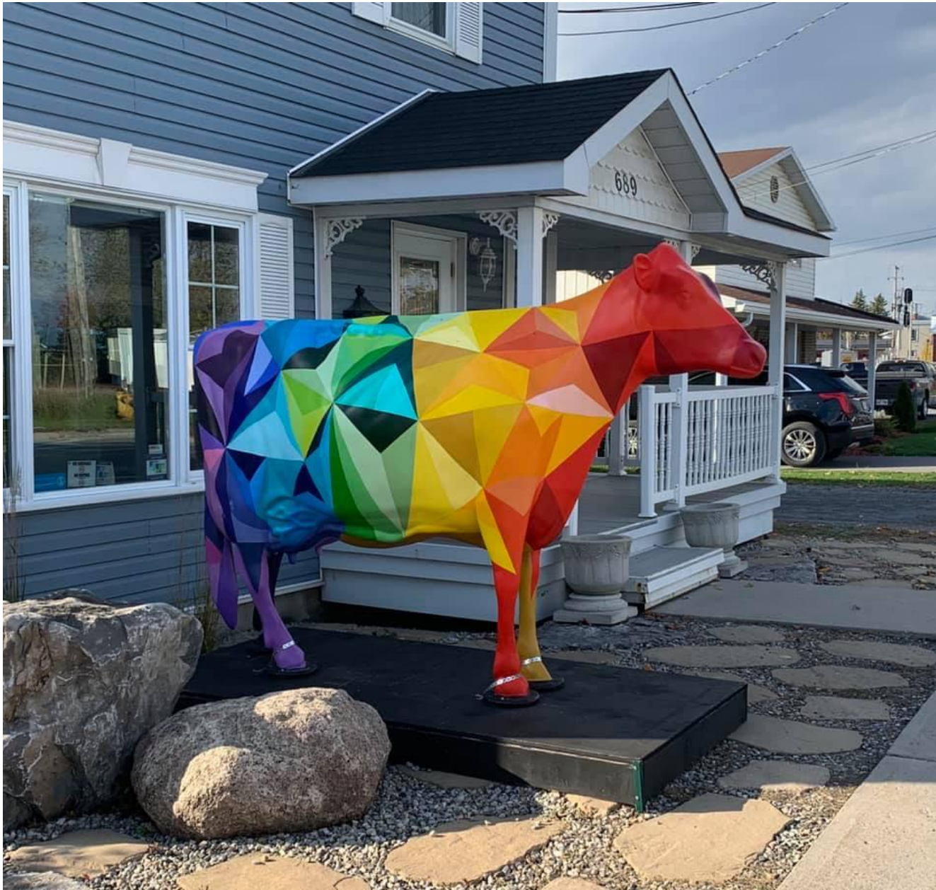
Œuvre d'art sur les espaces communs extérieurs de la copropriété