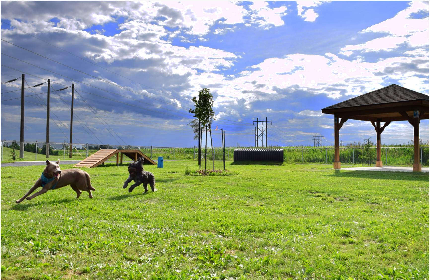
Parc à chiens sur les espaces communs extérieurs de la copropriété