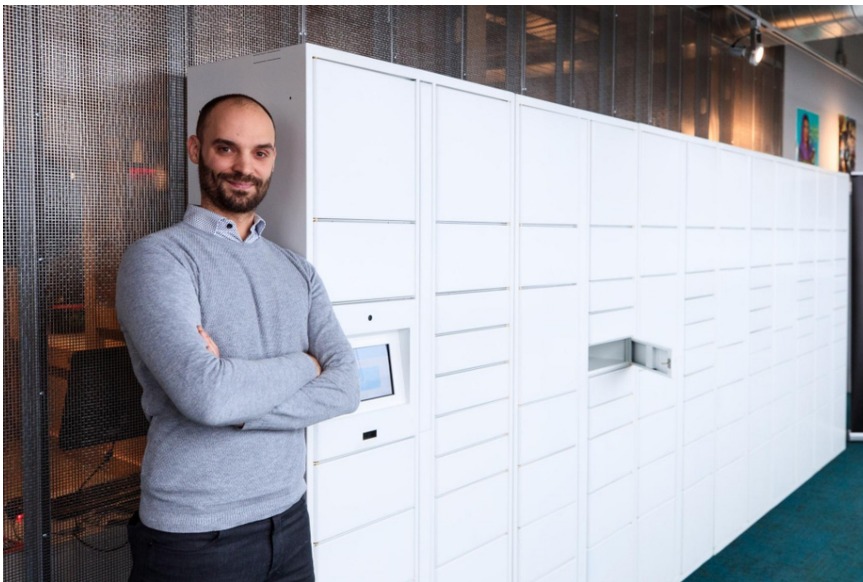
Casiers intelligents pour entreposage temporaire des colis livrés, dans un espace commun de la copropriété