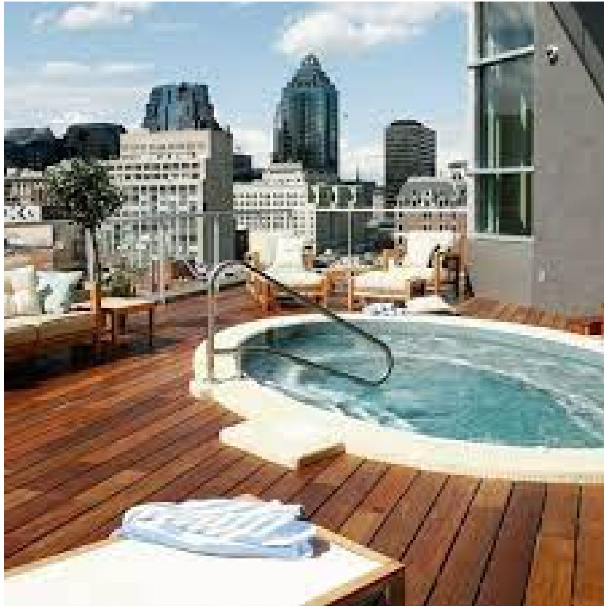
Jacuzzi sur le toit d'un immeuble ou sur un balcon/terrasse