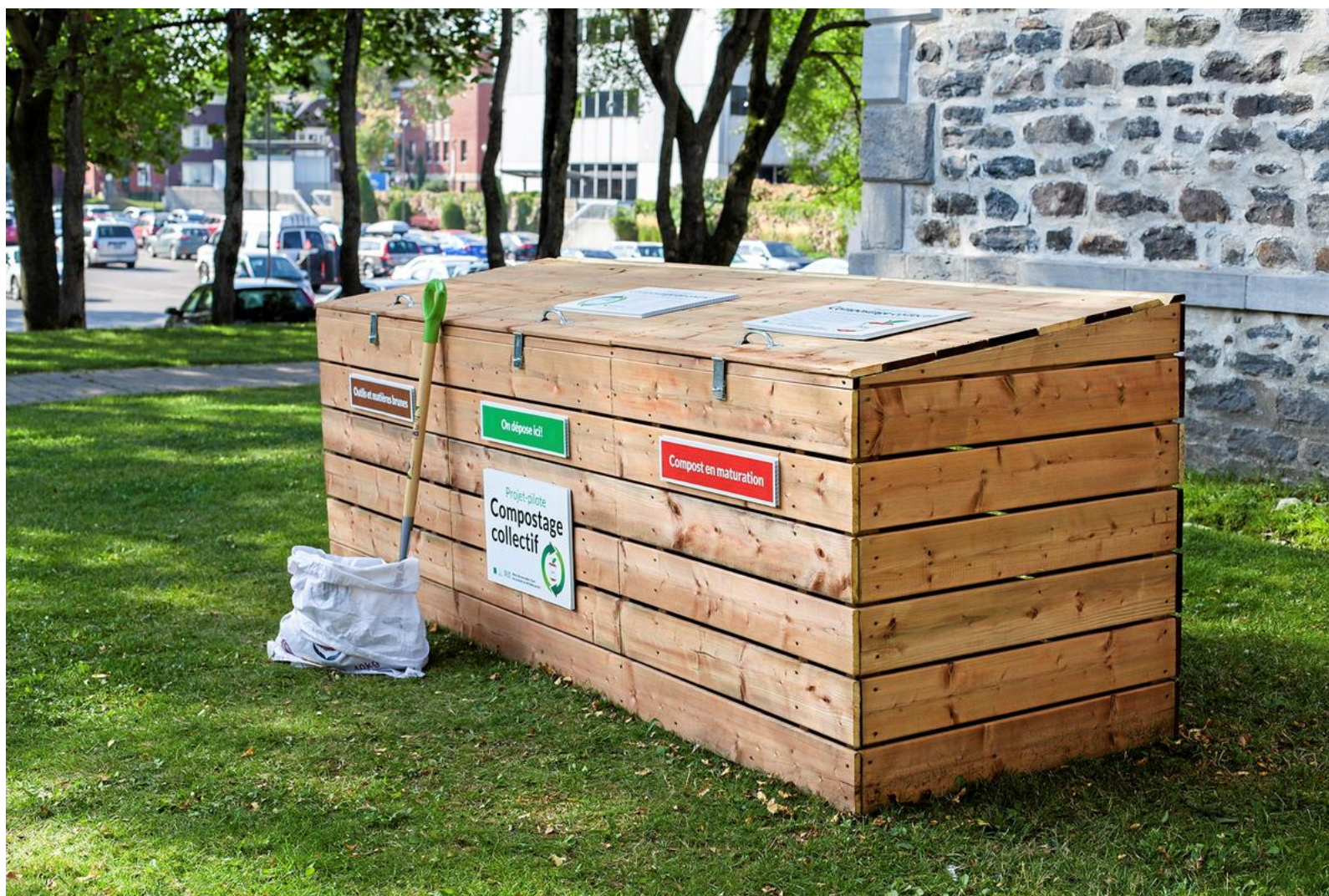
Bacs de compostage collectif sur les espaces communs extérieurs de la copropriété