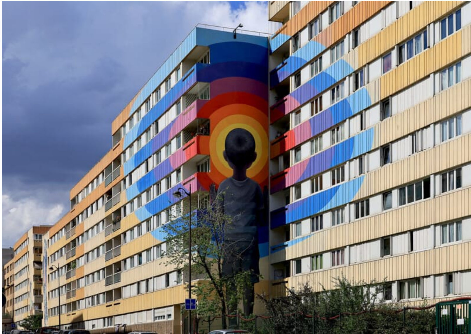
Œuvre d'art sur la façade de plusieurs immeubles en copropriété