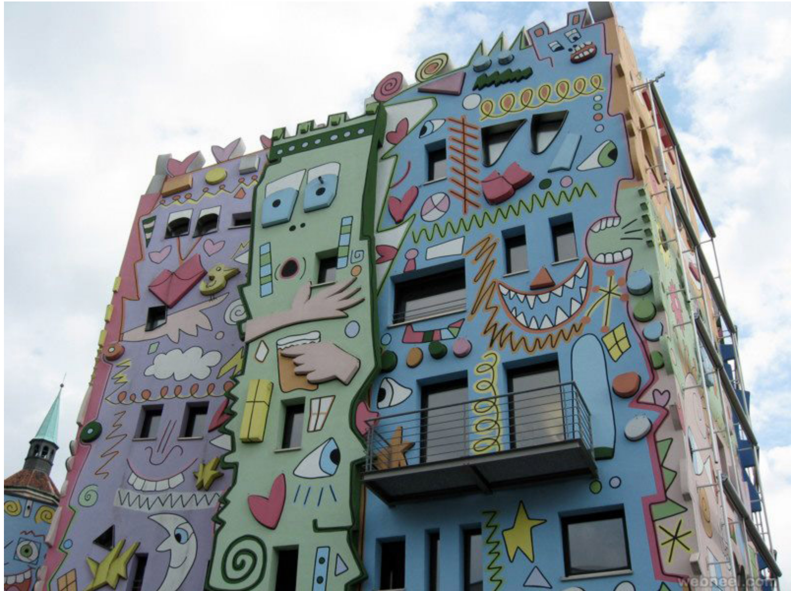
Œuvre d'art sur la façade d'un immeuble en copropriété